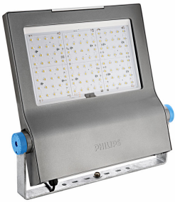
BVP650 - LED EconomyLine