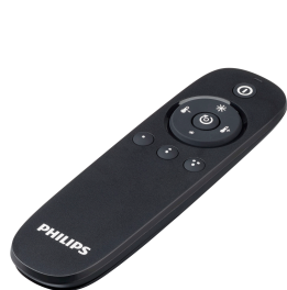
IRT9010/00 Transmitter IR Point